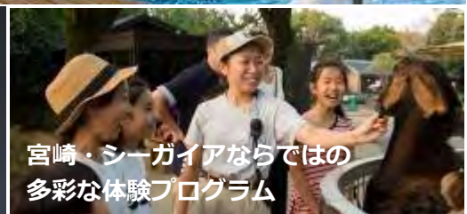
宮崎・シーガイアならではの 多彩な体験プログラム