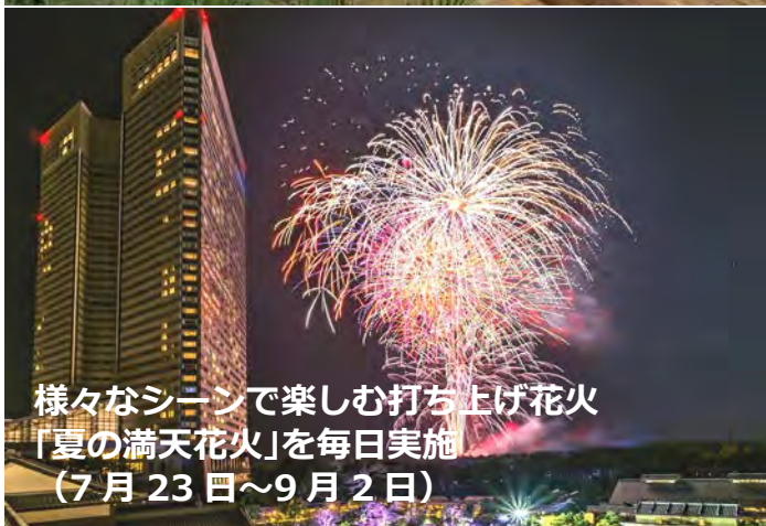
様々なシーンで楽しむ打ち上げ花火 「夏の満天花火」を毎日実施 （7月23日～9月2日）