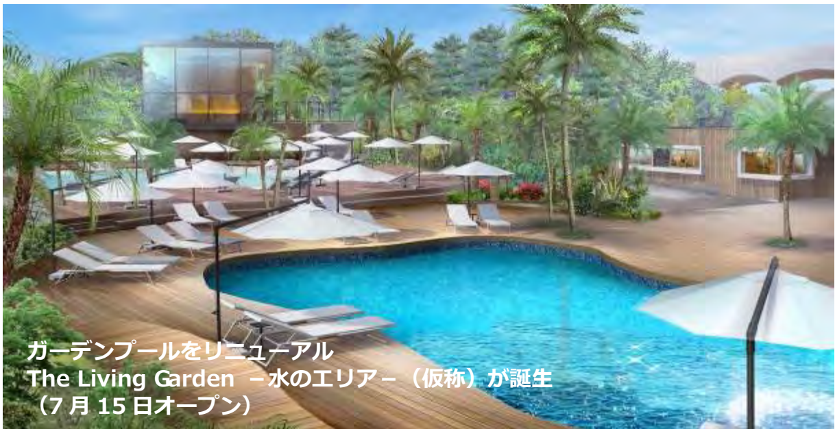
ガーデンプールをリニューアル The Living Garden -水のエリア-（仮称）が誕生 （7月15日オープン）