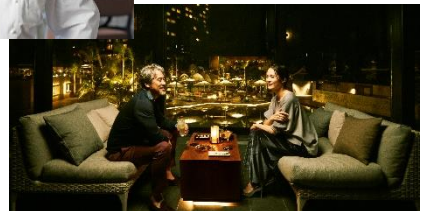
▼美しい夜景とお酒を楽しむ「KUROBAR」