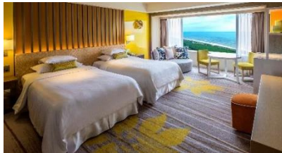
▲36階以上の高層階クラブフロアへ宿泊

開業以来最大規模となるリニューアルが完了し、雄大なロケーションを堪能するための空間演出や豊かな食、そしておもてなしなど、宮崎ならではの“体験価値”が揃うリゾートへ生まれ変わった『新しいシーガイア』での特別なリゾートステイをパッケージ。“BEAMS流 大人デート旅”をお楽しみいただけます。