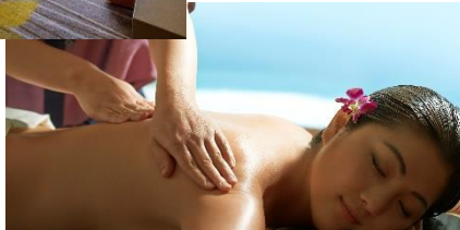
▼日本ではここだけ バンヤンツリー・スパ