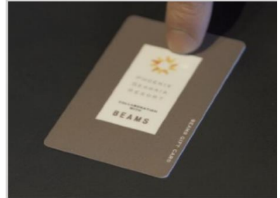
▲エスコートカード