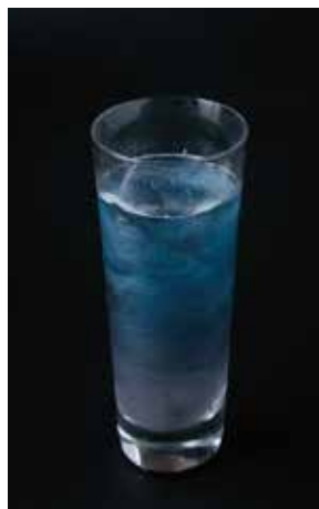
Outer Space Fizz

夜空に赤く輝く火星を、赤いパールリキュールを使用して表現。香り高く、艶やかなカクテルへ仕上げました。